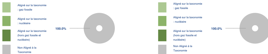
Ce graphique représente 100% du total des investissements.

Les deux graphiques ci-dessous font apparaître en vert le pourcentage minimal d'investissements alignés sur la taxonomie de l'UE. Étant donné qu'il n'existe pas de méthodologie appropriée pour déterminer l'alignement des obligations souveraines* sur la taxonomie, le premier graphique montre l'alignement sur la taxonomie par rapport à tous les investissements du produit financier, y compris les obligations souveraines, tandis que le deuxième graphique représente l'alignement sur la taxonomie uniquement par rapport aux investissements du produit financier autres que les obligations souveraines.