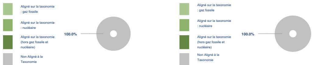
Ce graphique représente 100% du total des investissements.

Les deux graphiques ci-dessous font apparaître en vert le pourcentage minimal d'investissements alignés sur la taxonomie de l'UE. Étant donné qu'il n'existe pas de méthodologie appropriée pour déterminer l'alignement des obligations souveraines* sur la taxonomie, le premier graphique montre l'alignement sur la taxonomie par rapport à tous les investissements du produit financier, y compris les obligations souveraines, tandis que le deuxième graphique représente l'alignement sur la taxonomie uniquement par rapport aux investissements du produit financier autres que les obligations souveraines.